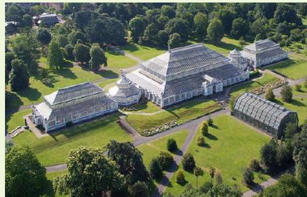
„Кю Гардънс“ – Лондон