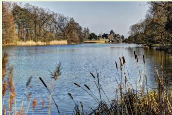
„Кралската градина Върлиц“, Десау