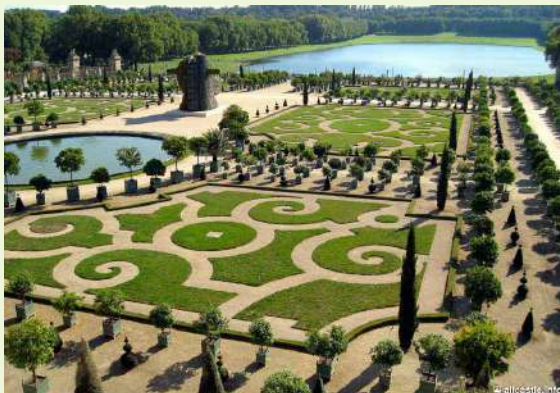
„Дворецът и паркът Версай“ – Париж